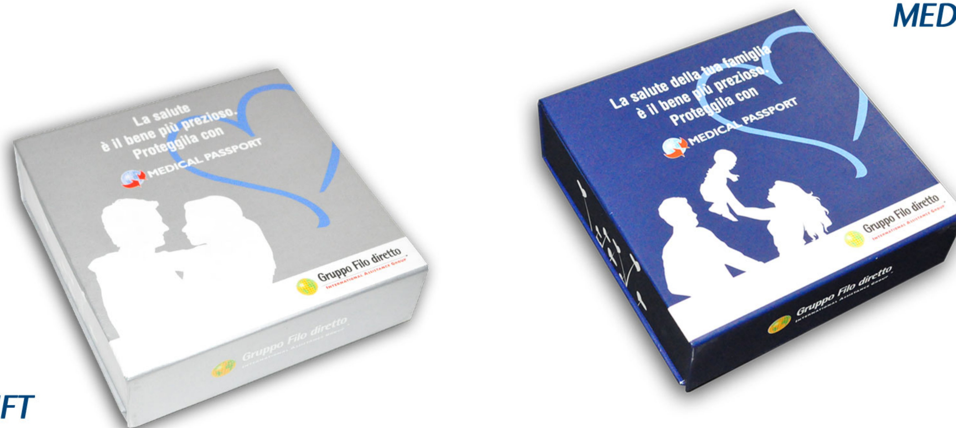
MEDICAL PASSPORT GIFT INDIVIDUALE

Ma non solo! Anche Medical Passport Gift prevede la versione Individuale o Family e, in più, sarà recapitato direttamente a casa del cliente in una elegante confezione regalo contenente, oltre alla Medical Passport Card, tutte le istruzioni su come attivare il servizio.